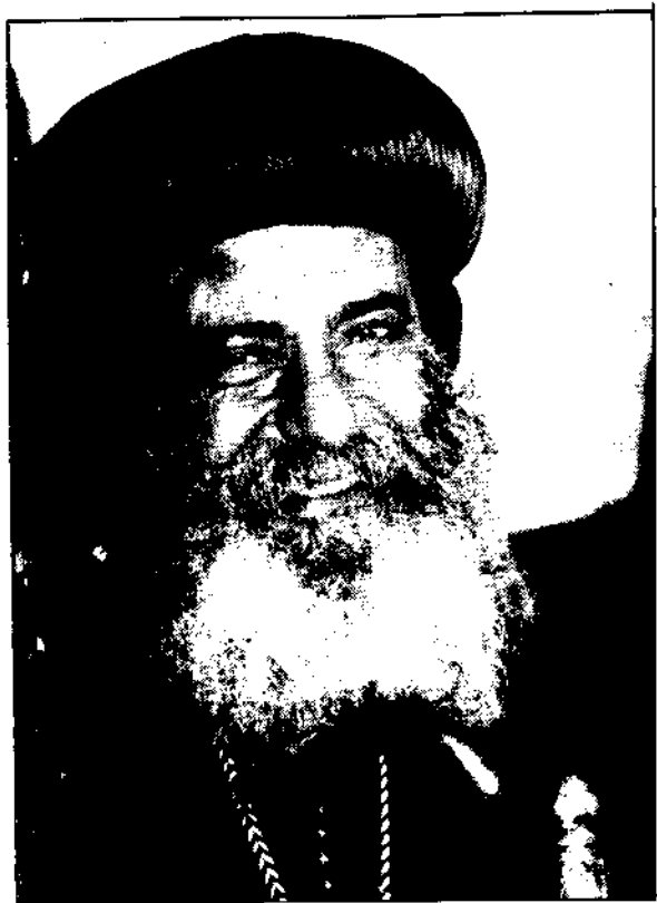
قراسة البابا شنودة الثالث